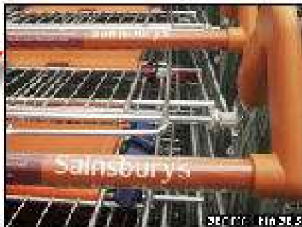
Ready meals are next on Sainsbury's green-packaging agenda

The move is the latest attempt by UK supermarkets to improve their green credentials.